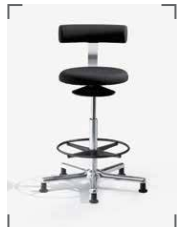
AOGO XL E