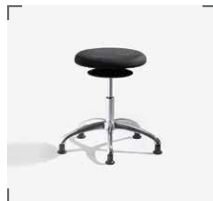
ERGO 3 A