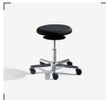
ERGO 3 E