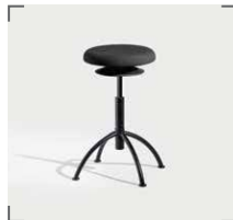
ERGO 3 V