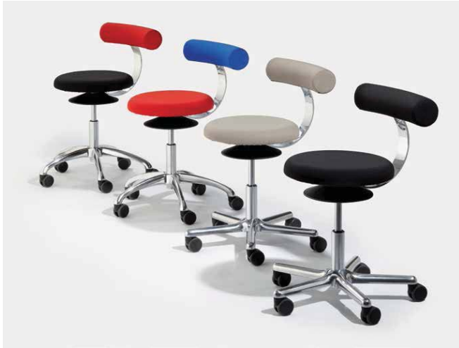
AOGO A und AOGO E