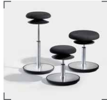
ERGO 1 und ERGO 2